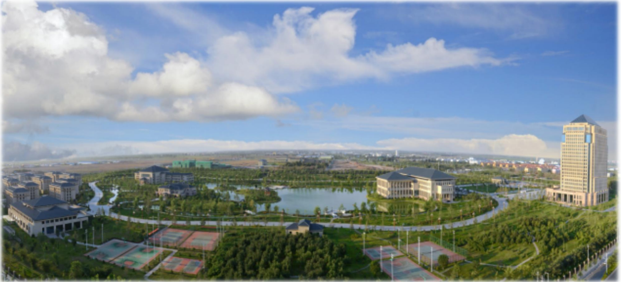
上图：特变电工商务区总部