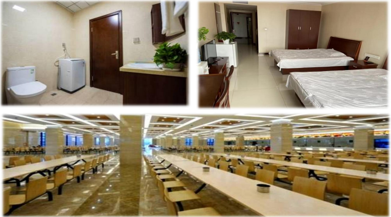
上图：食宿环境（商务区及项目公司）