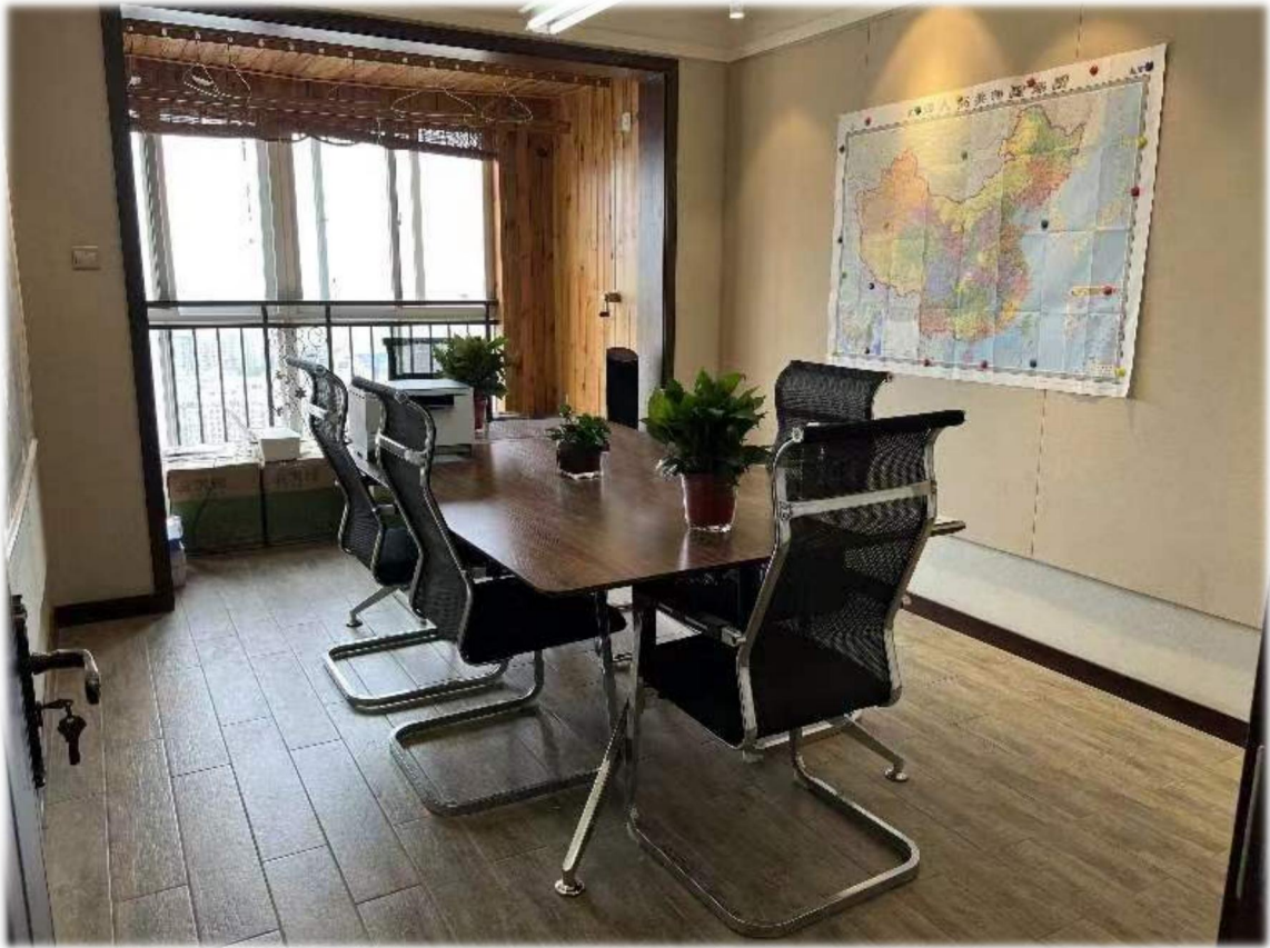
上图：销售公司陕西办事处